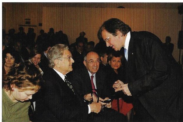
Diego Hidalgo saluda a George Soros, con quien ha lanzado el European Council for Foreign Relations en Europa.

que remueven los cimientos y a veces conmueven a la sociedad entera. Uno es el fenómeno incansable de la exigente reivindicación de beneficios para las comunidades llamadas nacionalistas, otro el hecho fatal del terrorismo etarra. Los distintos gobiernos desde 1977 han intentado casi de todo para resolver unas u otras cuestiones. Desde el otorgamiento de unos Estatutos tan generosos, muchos más anchos y concesionistas que los proclamados en la IIª República Española, hasta muy amplias muestras de buena voluntad con amnistías a presos de sangre y a encausados por cuestiones graves. A pesar de todo, poco se ha avanzado. Los radicalismos nacionalistas son ya y a diario abiertas proclamas sin freno frente a las leyes del Estado y en no pocos casos apologías del terrorismo.