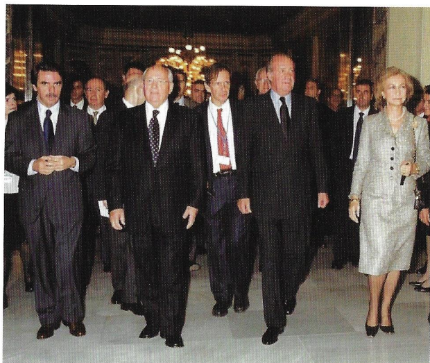
Con SS.MM. los Reyes, Mijaíl Gorbachov y José María Aznar en la Conferencia sobre la Transición y Consolidación Democráticas, llevada a cabo por FRIDE y la Fundación Gorbachov de Norteamérica y de la que nació el Club de Madrid.

crecimiento lento se enfrentan con una secesión, las perspectivas de China y muchos países asiáticos incluyendo India son de un gran crecimiento económico, que se van a traducir en un desplazamiento masivo de riqueza de Occidente a Oriente, y en el desarrollo de clases medias cada vez más prósperas, con gran poder adquisitivo, y ávidas de viajar. La diferencia con los mercados tradicionales de turismo es que éste no buscará playas y litoral, sino regiones con una cultura propia, incluyendo arquitectura y arte diferentes, y con grandes espacios que hayan respetado normas medioambientales. La ventaja comparativa de Extremadura es enorme, y sería aún mayor si las infraestructuras (sobre todo AVE desde aeropuertos) se desarrollaran suficientemente.