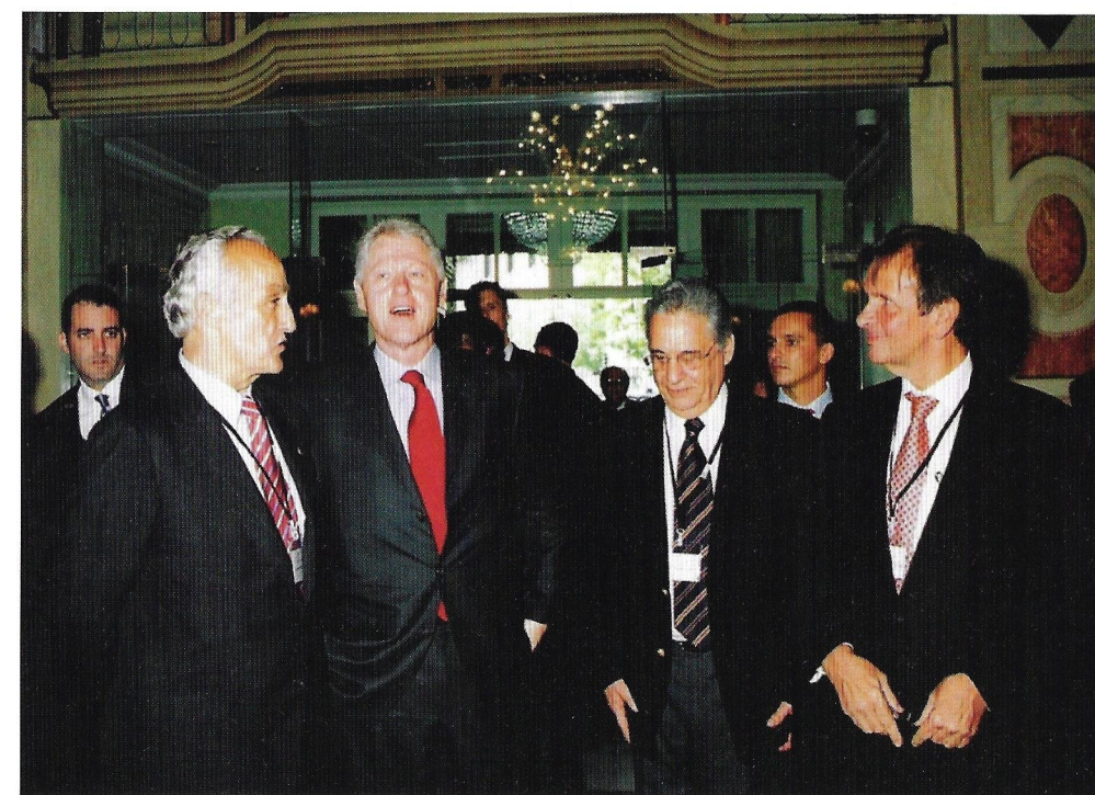
Antonio Álvarez-Couceiro, Bill Clinton, Fernando Enrique Cardoso y Diego Hidalgo en la Asamblea General del Club de Madrid en 2003.

Le daré algunos ejemplos. Muchos pasan por dar a conocer Extremadura en mercados de crecimiento. Por ejemplo, mientras Estados Unidos y la Unión Europea después de años de