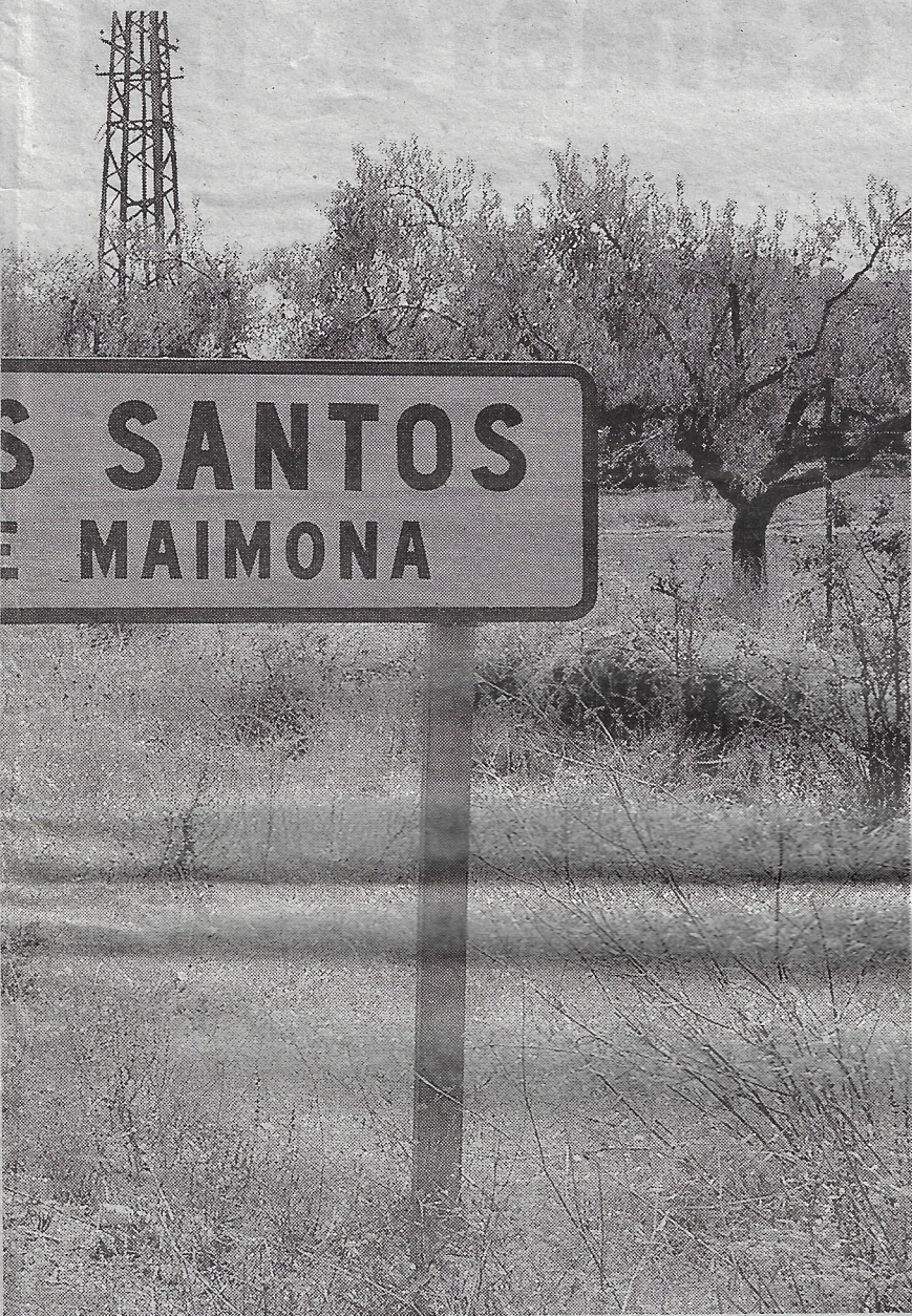
Los Santos, su pueblo de adopción.

—¿Por qué los países pobres son cada vez más pobres y los países ricos cada vez más ricos?