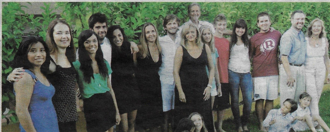
En su casa de Extremadura con parte de sus hijos y nietos durante el verano de 2010.