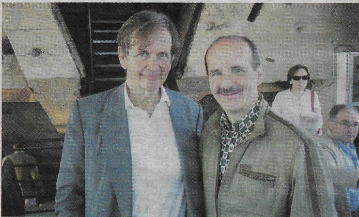
Con el ex presidente de Costa Rica, José María Figueres.