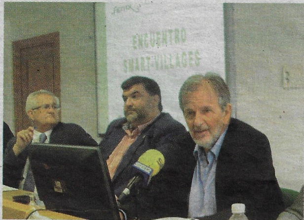
Acto en la Fundación Maimona.