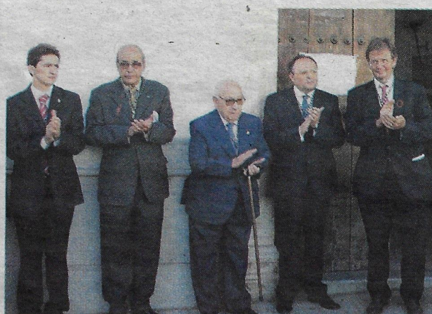
Tras recibir la Medalla de Oro de Los Santos.