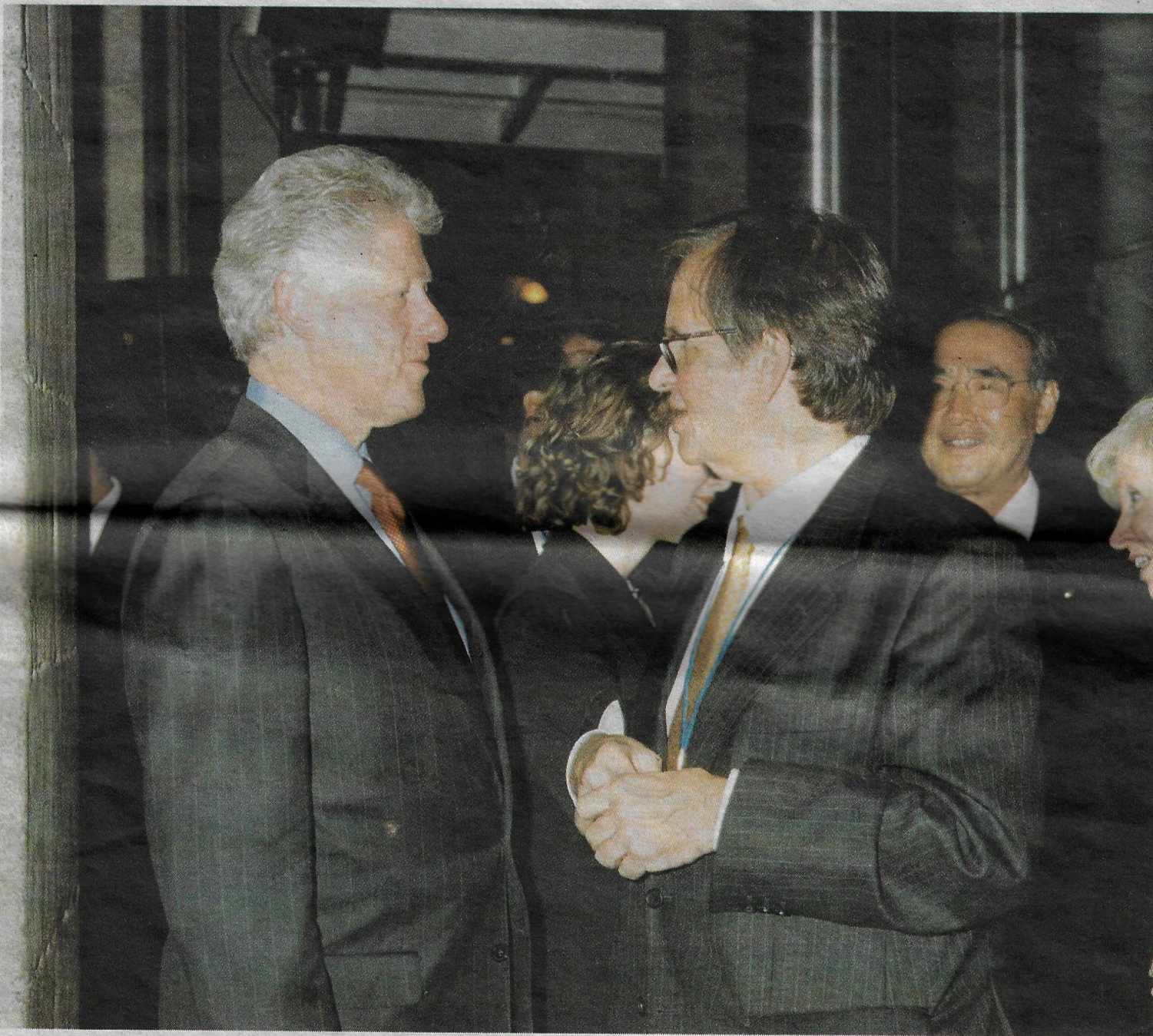
Esta fotografía recoge uno de sus encuentros con el ex presidente de EE UU Bill Clinton.